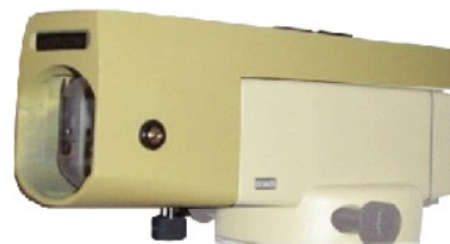
LAMINA PIANPARALLELA NA-32-PP

Micrometro 10mm a lamina piana parallela, installabile sul cannocchiale del Tecnix NA-32. Ottica in cristallo BAK4. La lettura diretta al micrometro della lamina è di 0.1mm e la stima può arrivare anche a 0.01mm. Rende possibile il raggiungimento della precisione nell'ordine dei \pm 0,5 mm.